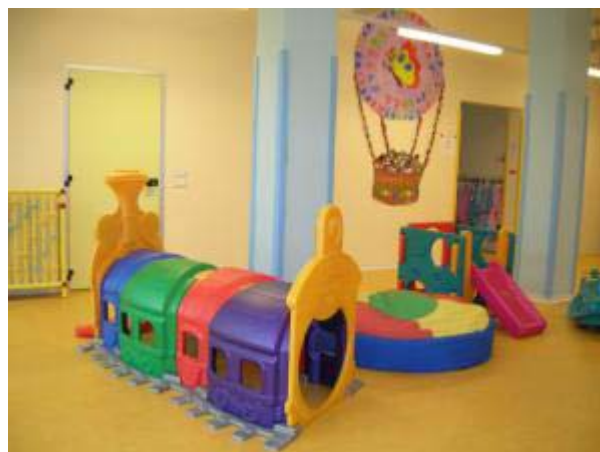
- Scuola dell'Infanzia via Tappi