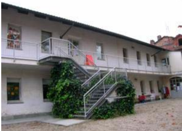
- Scuola dell'Infanzia via Forneri

spazio esterno attrezzato. E' un ambiente molto piacevole progettato con cura e a misura di "piccoli allievi".